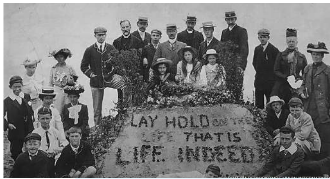
Una de las primeras misiones en la playa.