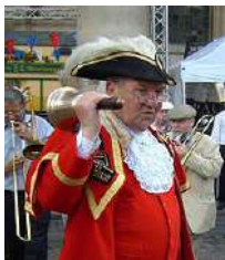
Pregonero típico de la época.